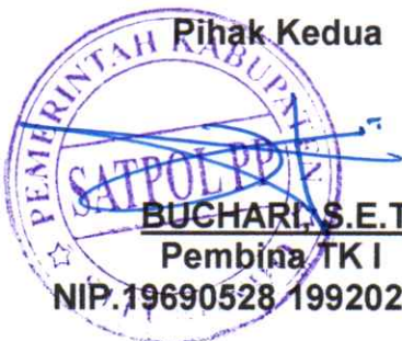
BUCHARI, S.E.T Pembina TK I