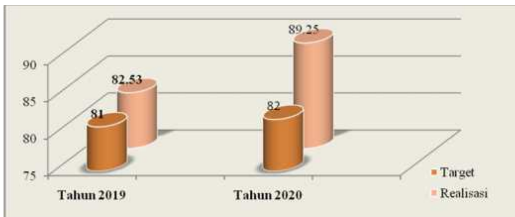
Gambar 3.1 Prosentase Nilai Survey Indeks Kepuasan Masyarakat (IKM) Kecamatan Situbondo

Pada sasaran Meningkatnya Kualitas Pelayanan Administrasi Terpadu Kecamatan dengan indikator Nilai Survey Indeks Kepuasan Masyarakat (IKM) Kecamatan Situbondo tidak ada hambatan / permasalahan. Hasil Perhitungan Indeks Kepuasan Masyarakat (IKM), melebihi target yang telah ditetapkan pada perjanjian kinerja sebesar B (82) terealisasi A (89,25) Kategori sangat baik, dengan pencapaian target kinerja sebesar 108,84%.