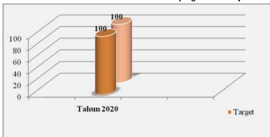
Persentase Rekomendasi Hasil Koordinasi yang ditindaklanjuti

Pada sasaran Meningkatkan Kualitas Penyelenggaraan Pemerintahan Kecamatan dan Pembinaan Pemerintahan Desa dengan Indikator Persentase Rekomendasi Hasil Koordinasi yang ditindaklanjuti dengan target 100% telah memenuhi pencapaian target kinerja 100%.